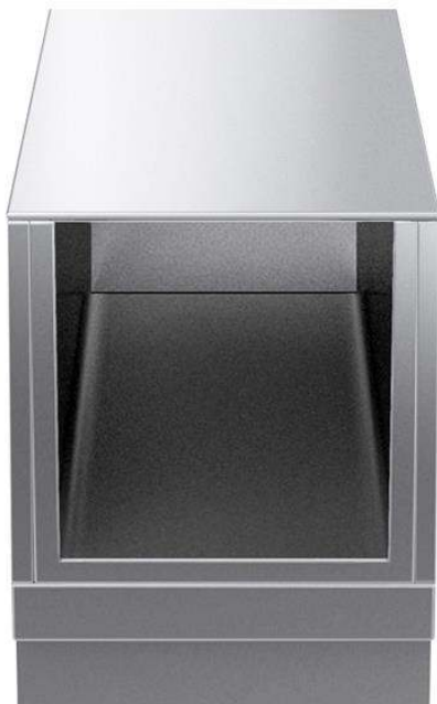
588636 Base ouverte GN, 400mm travail sur 1 coté (MBINCADOOO)